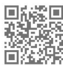
水泉澳 打氣短片連結