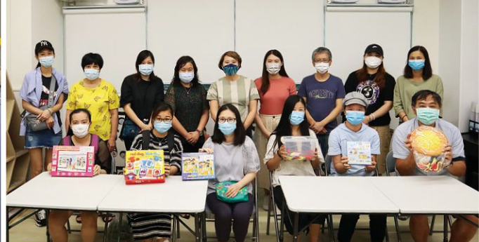
服侍 SEN 幼稚園學童家長