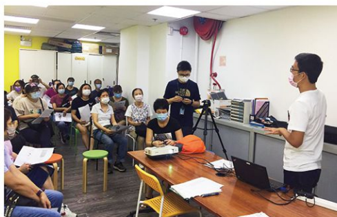
街坊和教會義工探訪訓練