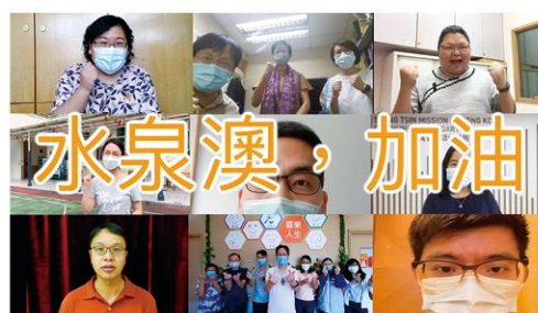
為水泉澳居民拍攝打氣短片