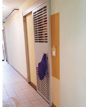
無接觸派送抗疫物資