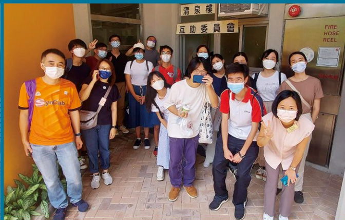
沙田圍堂青年人參與

疫情前，本會和「教關」已成為由「中文大學醫學院」主辦，在水泉澳邨的一項政府資助三年社區服務計劃（名為「ABCD 家泉戶曉齊結網」，簡稱 ABCD）的合作伙伴單位。雖然疫情令這計劃延遲推行，但卻興起了一大群街坊義工，我嘗試帶領網絡團隊組成了一個期望覆蓋全邨的「泉心護你探訪隊」。這個來自街坊和教會信徒的義工網絡是由「中文大學醫學院」的 ABCD 主導，「教關水泉澳網絡」同工主力執行。義工團隊經過四堂家訪和一些基本護理訓練後，我們暫時已組織了邨內十五幢樓（期望全邨有齊十八幢）的街坊和教會義工小隊，每小隊義工會定期關顧被編配的獨居或雙老的長者。去年聖誕期間，義工大隊首次出動家訪長者，上門前我們喊出義工團隊的口號：「泉心護你探訪隊，街坊出入傾幾句！」